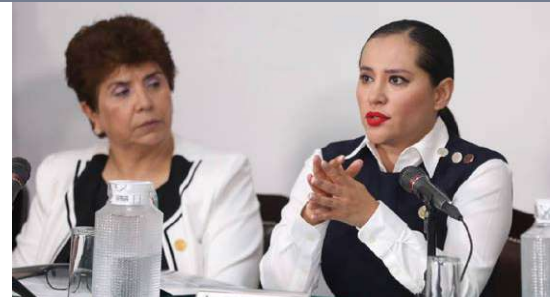
Imagen Urbana, así como Educación, Cultura, Arte y Deporte.

Para detallar el trabajo que ha desarrollado desde su llegada, la Alcaldesa dividió su informe en cinco bloques: Desarrollo Económico, Seguridad Ciudadana y Protección Civil, Protección a Grupos Prioritarios, Desarrollo de